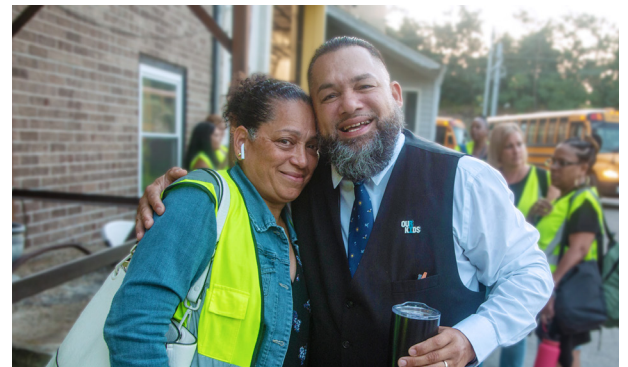
DR. JAVIER MONTAÑEZ SUPERINTENDENTE

Hemos alcanzado un hito importante, abrimos no solo una sino tres escuelas nuevas por primera vez en más de una década. Deseo expresar mi agradecimiento al gobernador McKee, comisionada Infante-Green, alcalde Smiley, y a nuestra junta escolar por su invaluable apoyo y por acompañarnos en el primer día de nuestras visitas escolares. Hace apenas dos semanas, tuve el privilegio de cortar el listón inaugural en el Centro de Aprendizaje Narducci, el cual ahora sirve como espacio temporal para la Primaria Pleasant View durante sus renovaciones. Este logro no hubiera sido posible sin la dedicada labor de nuestros socios; gracias por hacerlo posible. Estamos emocionados de dar la bienvenida a nuestros estudiantes y al personal a la nueva Primaria William D'Abate y a la Primaria Frank D. Spaziano, marcando así tres nuevas escuelas abiertas habilitadas para el aprendizaje del siglo XXI este año en PPSD. Nuestro compromiso de brindar una educación de calidad y nuevas facilidades sigue reafirmandose a medida que cumplimos con nuestras metas del Plan de Acción para la Transformación. Nuestras nuevas escuelas están equipadas con modernas instalaciones y tecnologías para mejorar la experiencia de aprendizaje y continuar con nuestros planes de servir a los estudiantes de Providence e invertir en el Distrito.